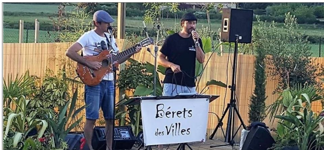
Les Bérêts des villes ont donné une trentaine de concerts suite à la sortie de leur premier album