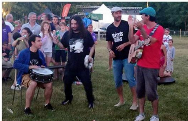
Au festival du pigeonnier le 29 juillet, le groupe Bérêts des villes a improvisé une prestation voix et percussions, rejoint par le groupe The 4L boys.