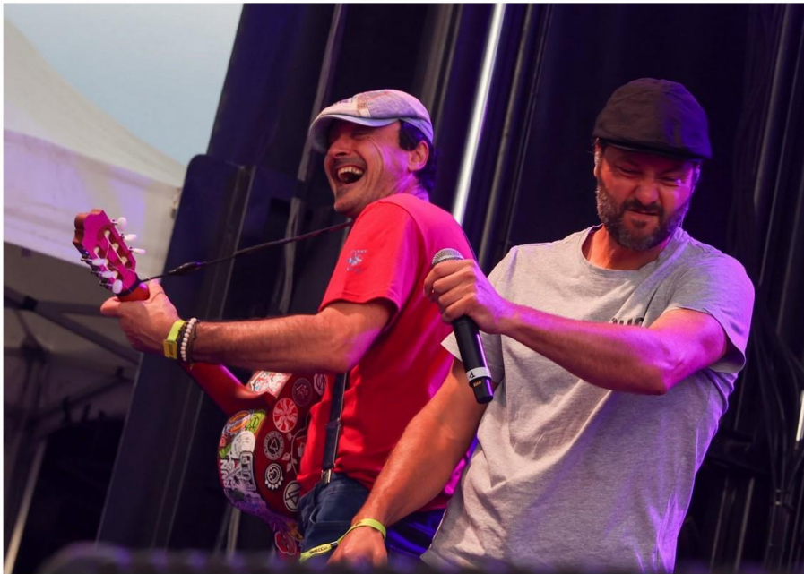
Bérets des villes sera sur scène samedi à 20 heures.