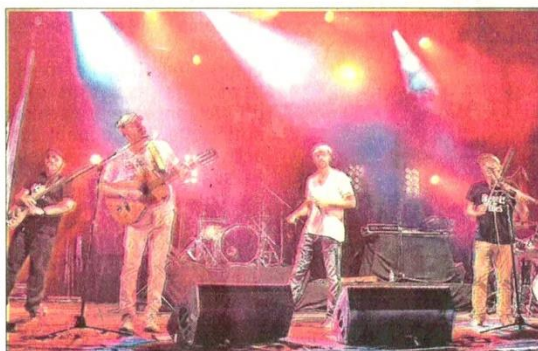
Les Bérets des Villes (à gauche) ont fait la première partie des Pitt Poule (à droite).