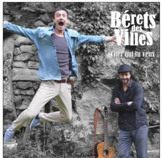
Un premier album pour les Bérêts des villes, sorti le 20 octobre dernier