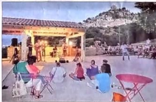
Mercredi 10 août, le public avait répondu présent pour le concert gratuit des Bérêts des villes, au pied du château médiéval.

très sympathiques et pleins d'humour, une envie irrésistible de faire danser les pieds et taper des mains, et les petites mousses de Fabien Pelaez, dans son beer-truck Emotion'Ale, ont aussi fait de cette soirée un moment unique sous les étoiles, au pied de la majestueuse forteresse médiévale qui a repris l'habitude estivale de s'animer au son de musiques de tous les styles, pour le plus grand plaisir de petits et grands qui ont souffert du manque de fêtes depuis 2020 !