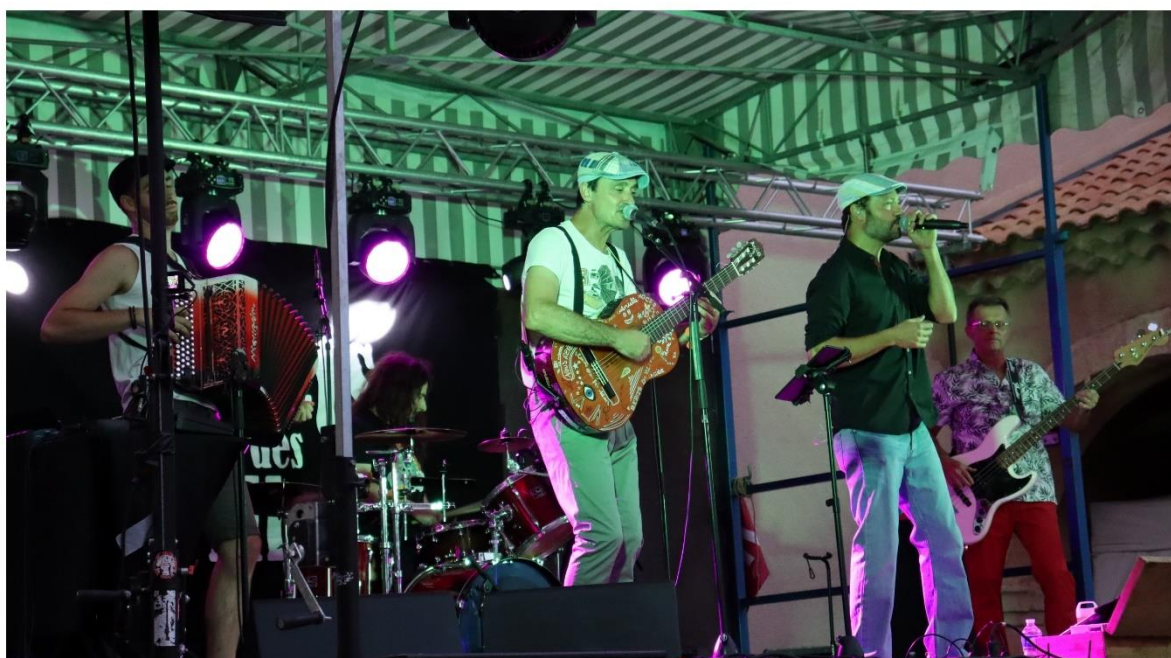
Le groupe privadois de chansons festives Bérets des villes devrait mettre l'ambiance sur la scène Météore.

Le festival Aluna revient à Ruoms (Ardèche méridionale) en même temps que la promesse des beaux jours. Cette année, le rendez-vous musical incontournable du sud Ardèche aura lieu du 29 juin au 1 er juillet.