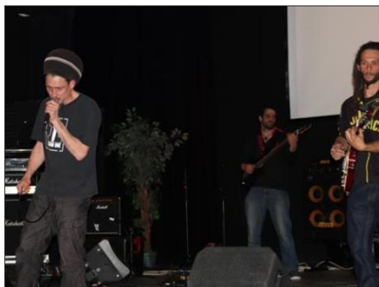
Les Béréts des Villes, White Lion et Purmalt Band se sont succédé sur scène, pour une soirée musicale réussie. Philippe BERTHELEMY