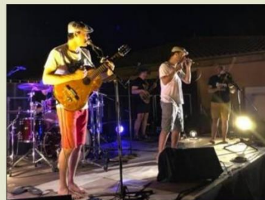
Les Bérêts des villes sont prêts à repartir en tournée pour présenter leur nouvel album.

Un récital d’environ une heure avec, pour finir, la projection du film “The Kid”, de et avec Charlie Chaplin : « C’est un clin d’œil sur ce cinéma d’une autre époque, celui du muet, explique Nicolas Bertin. Une manière de terminer la soirée par l’un des plus grands comédiens et réalisateurs du XX e siècle. »