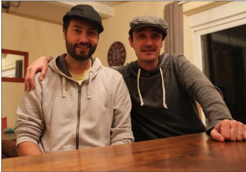
Les Bérêts des villes : deux copains d'abord.

Bref, quelques rencontres plus tard, ils ont envisagé l'écriture de quelques chansons pour, au final, enregistrer un premier CD sorti le 20 octobre dernier.