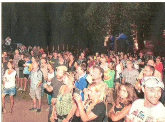
Le public s'est laissé embarquer par les deux prestations, comme celle des Pitt Poule, dont le chanteur était proche de la foule.

Ce vendredi 2 août, soirée rock avec les locaux The 4L Boys puis Miss America, puis ce samedi de la chanson folk en ouverture avec Vince Terranova et Nataverne, du celto-rock médiéval en seconde partie. Concerts gratuits avec participation libre à partir de 21 heures au parc Baubin.