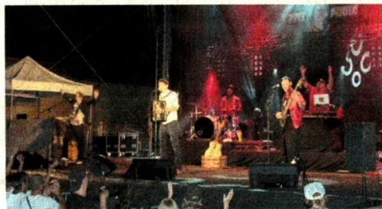
La bonne humeur de « Pitt Poule » sur la scène des Kiosques.

C'est un autre style de musique qui a régalé le public pour cette seconde partie originale de Chambéry « Pitt Poule ». Ça hip, ça hop, ça jazz, ça manouche, cinq musiciens de sensibilité différentes et réunis pour une musique au brassage ethnique du nomade de l'Est, au déporté afro-américain. Passé par le festival Jazz in Marciac, le Musilac d'Aix-les-Bains, le Transbordeur à Lyon, c'est à la Voulte pour une soirée qu'ils nous ont offert un concert où le talent frôle le génie.